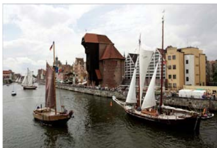
Baltic Sail Gdańsk 2008